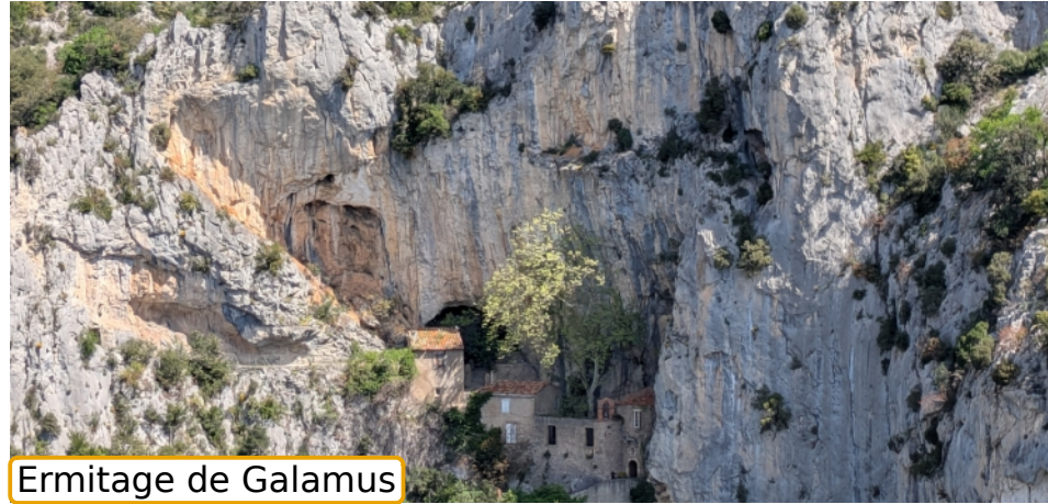
Ermitage de Galamus