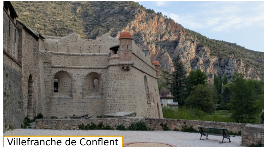
Villefranche de Conflent