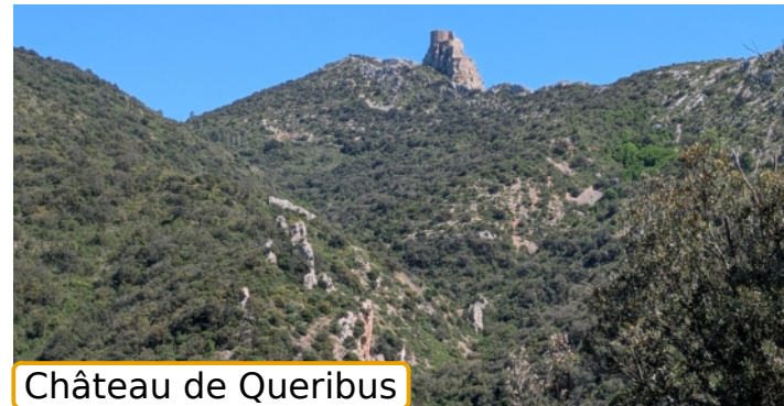
Château de Queribus