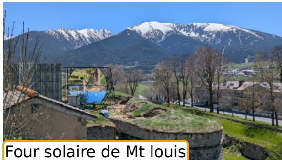
Four solaire de Mt louis