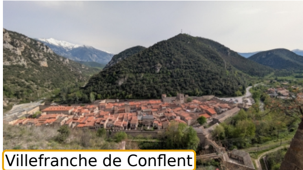
Villefranche de Conflent