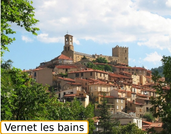
Vernet les bains