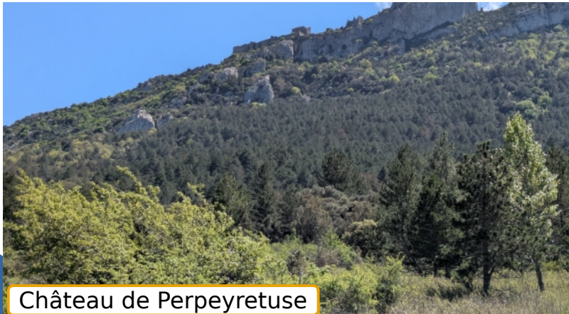
Château de Perpeyretuse